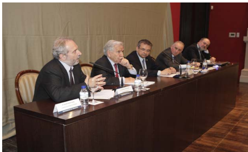
FOTO 2: II Encuentro en la Universidad “Gestionar en tiempos de Crisis”

Gestionar en tiempo de crisis. Ignacio Santillana. Director General del Grupo Prisa