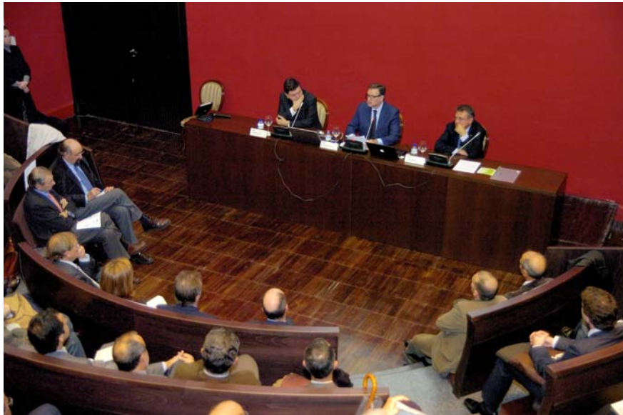
FOTO 1: I Encuentro ¿Son las energías renovables una alternativa suficientes?

En definitiva, constatamos que las energías renovables, con el debido esfuerzo y la inversión en I + D + i necesarias, pueden convertirse en la alternativa suficiente, acompañadas siempre de la eficiencia y un cambio en los hábitos de consumo tanto de las empresas como de las Administraciones Públicas y de la ciudadanía en su conjunto. Y no está de más recordar la necesidad de actuar en las iniciativas en las que existe un consenso básico, mientras se siguen debatiendo aquellas en las que existe controversia.